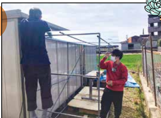
まずは苗を育てる為の簡易ハウスを作りました！