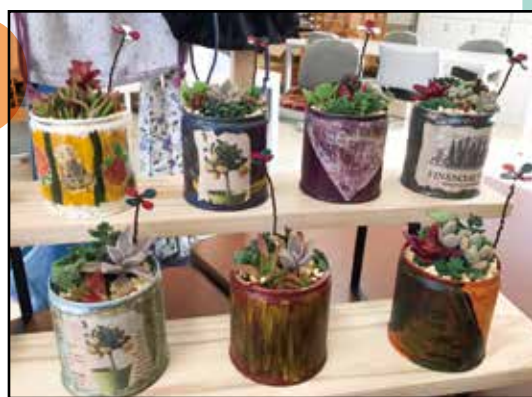
ハンドメイドの飾りをつけたり 数種類完成しました♪