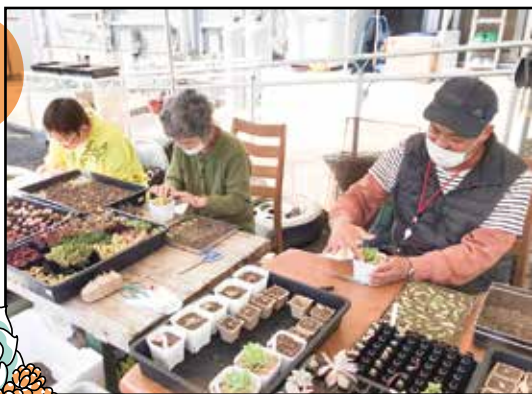
ポットへの植付けも笑顔がこぼれ、 成長が楽しみです。