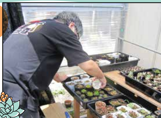
水やりもしっかり！ 毎日のお世話が欠かせません