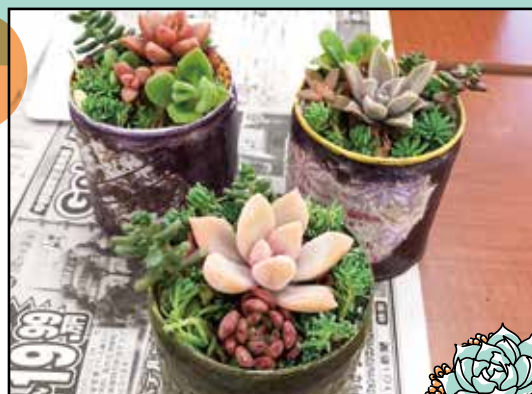
マルシェに出す為 寄せ植えにしました。