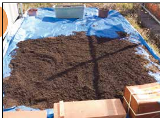
そして次は土作り♪ 苗がしっかり育つには重要なポイントです。