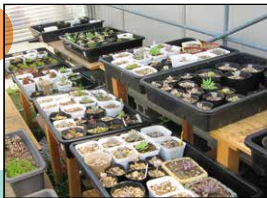
夏の暑い時期もハウスの日よけがあるので大丈夫★ 簡易ハウスは大活躍！