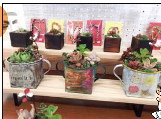
器もメンバーさんのペイントした物や 木工で制作した物です☆彡